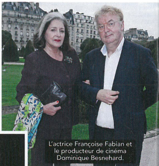
L'actrice Françoise Fabian et le producteur de cinéma Dominique Besnehard.